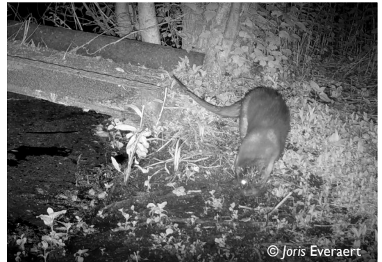
Otter in het Groot Molsbroek in mei 2022. Cameravalopname (zie ook video's op YouTube kanaal Joris Everaert)

genetische analyse weten we ondertussen ook dat hij afkomstig is uit Nederland (Flevopolder). Hij legde maar liefst 200 kilometer af om zijn huidig leefgebied te bereiken (meer info in de nieuwsbrieven op inbo.be).