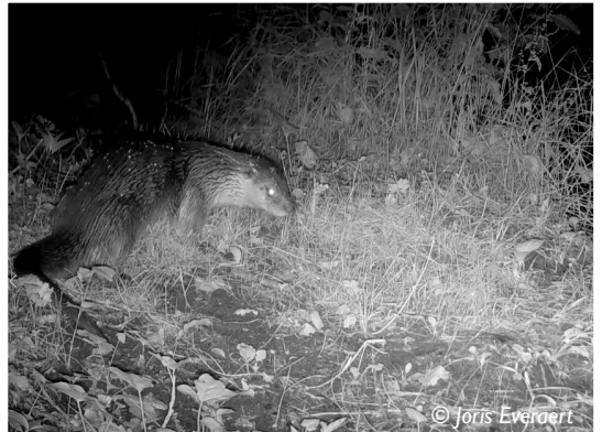
Otter legt spraint in Berlare in juni 2022. Cameravalopname (zie ook video's op YouTube kanaal Joris Everaert)

zone Donkmeer in Berlare. Dit doet ons steeds meer vermoeden dat de otter tussen Lokeren en Berlare misschien een 'shortcut' neemt via het landbouwgebied ten zuiden van de E17 in Zele (zie mogelijke routes op onderstaande kaart). Er valt dus nog veel te ontdekken, maar het is duidelijk dat het hier een opmerkelijk dier betreft! We hopen dat hij op zijn route niet sterft door een auto op enkele mogelijke verkeersknelpunten die in kaart zijn gebracht. In 2023 start op Vlaams niveau het Soortenbeschermingsprogramma (SBP) Otter, waarbij heel wat maatregelen zullen worden genomen. In onze regio loopt hierrond ook een lokaal project 'Otterland', in samenwerking met vzw Durme (zie o.a. via 'projecten' op rlsd.be).